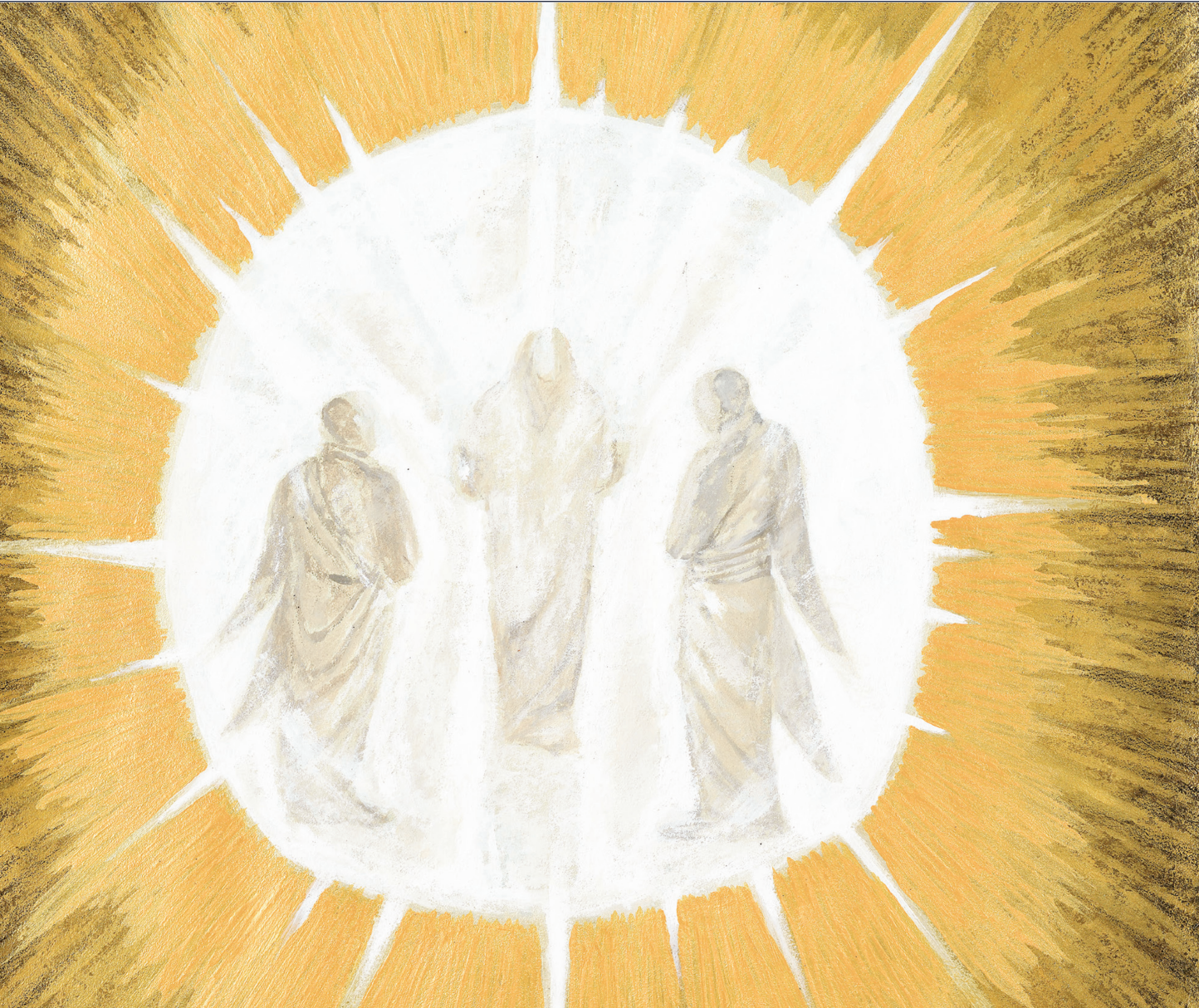
그림 : 정미연 소화데레사

2021년 교구장 사목교서 - “너희는 나를 기억하여 이를 행하여라.”(루카 22,19)